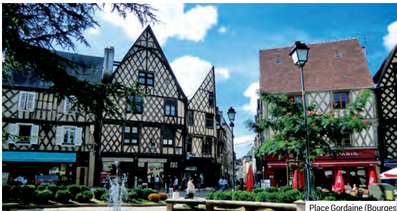
Place Gordaine (Bourges)