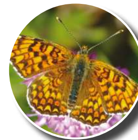
Méliée des centaurees ou Grand damier