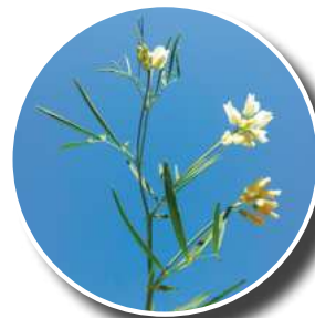
Gesse de pannonie