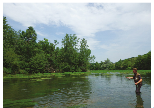
Pêche à la mouche – Rivière « Le Cher » Juin 2013