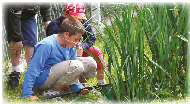
Animations : rivière « La Rampenne » Parcours pédagogique de la Fédération départementale de la pêche Juin 2005 et mai 2008