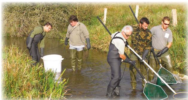
Pêche électrique (inventaire piscicole) Cours d'eau « Le Vernon » Octobre 2009