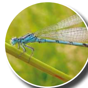
Agrion de Mercure