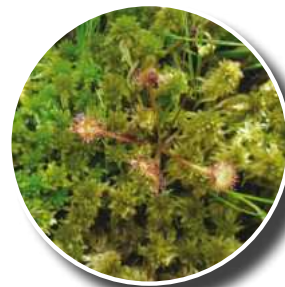
Drosera à feuilles rondes