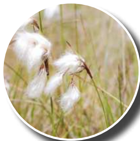
Linaigrette à feuilles étroites

Retrouvez le calendrier des animations nature : departement18.fr/-Les-escapades-nature-