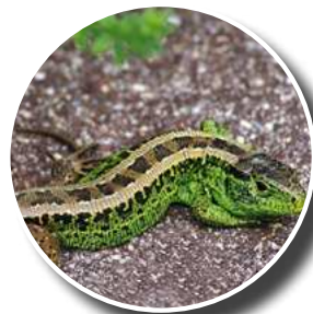
Lézard des souches