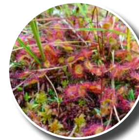
Droséra à feuilles rondes