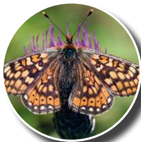
Damier de la succise

Retrouvez le calendrier des animations nature : departement18.fr/-Les-escapades-nature-