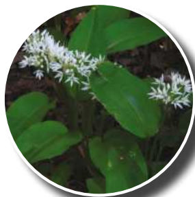
Ail des Ours

Retrouvez le calendrier des animations nature : departement18.fr/-Les-escapades-nature-