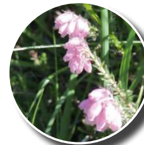
Bruyère à quatre angles