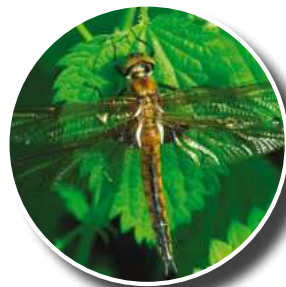
Cordulie à 2 taches