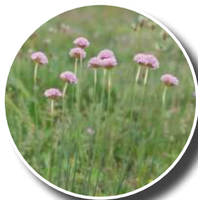
Armérie des sables

Retrouvez le calendrier des animations nature : departement18.fr/-Les-escapades-nature-