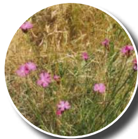
Œillet des Chartreux