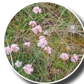
Armérie des sables