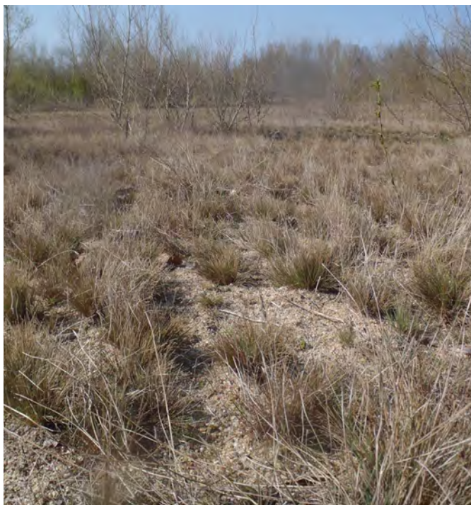
Pelouse à Corynéphore

Un sentier permet de longer les pelouses, des zones de boisement et d'anciennes zones d'extraction.