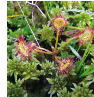
Sphaignes et Droseras rotundifolia