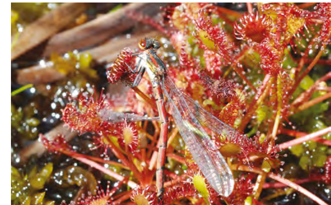
Droseras intermedia et petite nymphe du corps de feu

De toutes les couleurs et de toutes les tailles, Cordulie à taches jaunes, Agrion délicat... les libellules volent en reines sur la tourbière au son des Criquets des marais. Elles se méfient de la Grande Dolomède, une des plus grosses araignées d'Europe.