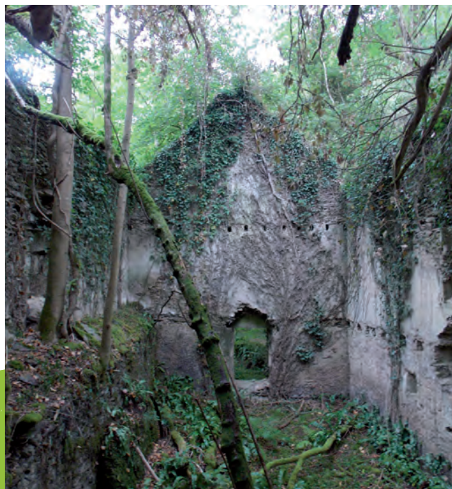
Les ruines du Moulin des Fougères

Les vestiges de l'occupation humaine du site, avec les ruines du moulin et de l'habitation du meunier abandonnées dans les années 1920, contribuent à l'ambiance très particulière de ce site.